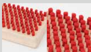
Spazzola rettangolare nylon 6 mm