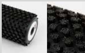
Spazzola cilindrica crine 5 mm; lunghezza 10 cm