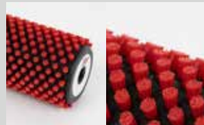
Spazzola cilindrica in nylon altezza 7 mm;