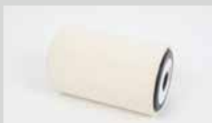
Rullo cilindrico con feltro, lunghezza 6cm