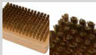
Spazzola rettangolare ottone 8mm