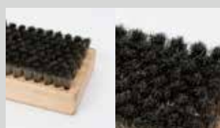
Spazzola rettangolare acciaio inox 10 mm