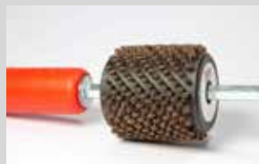
Spazzola cilindrica mix crine e nylon 5,5mm, lunghezza 6cm