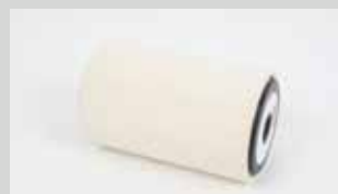
Rullo cilindrico con feltro, lunghezza 10cm