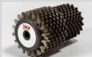
Spazzola in crine e inox Lunghezza: 11,5cm