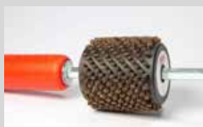
Spazzola cilindrica crine nero 7mm, lunghezza 6cm