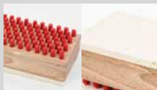
Spazzola rettangolare piccola, lato feltro/ lato nylon