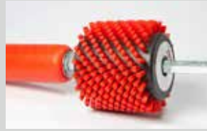
Spazzola cilindrica in nylon altezza 7mm, lunghezza 6cm