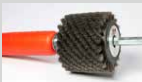
Spazzola acciaio alta qualità Ø 0,10mm; 10mm; lunghezza 6cm