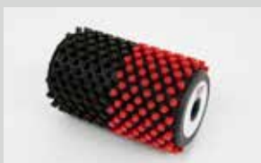
Spazzola cilindrica doppia nylon crine nero 5mm, 11,5cm