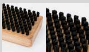
Spazzola rettangolare crine lungo 8 mm